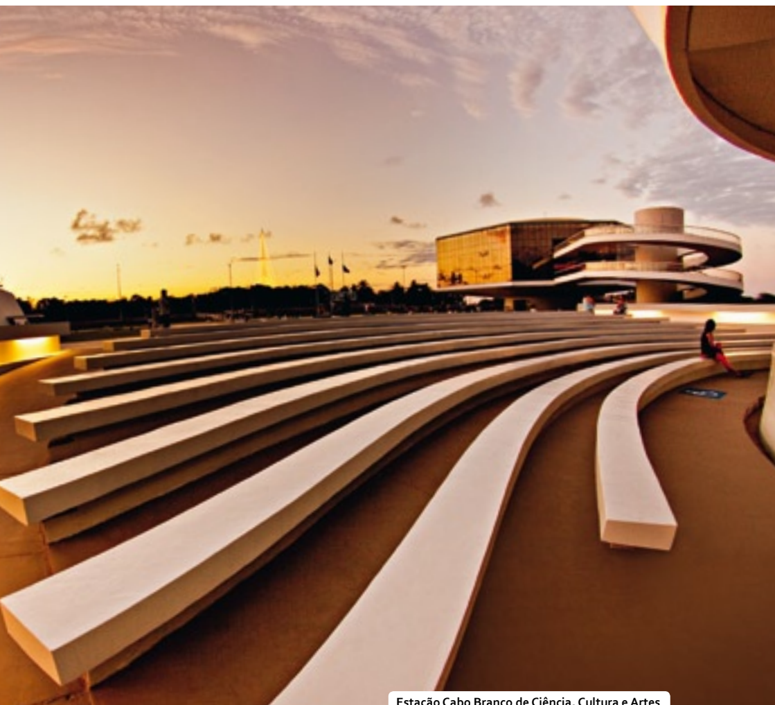
Estação Cabo Branco de Ciência, Cultura e Artes